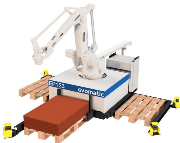
VY FRÅN SIDAN