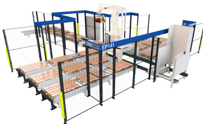
VY FRÅN SIDAN

EP141 är en helt fristående robotcell som med hög precision och takt mixpalleterar från pall på bana till produktpall på utbana. Grunden är en standardutrustning men med goda möjligheter till enkel kundanpassning efter specifika produkter och krävande behov.