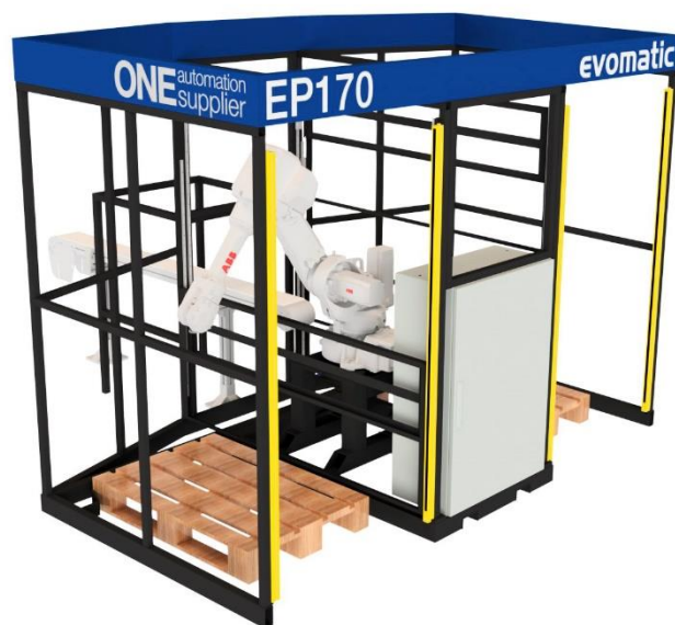
VY FRÅN SIDAN