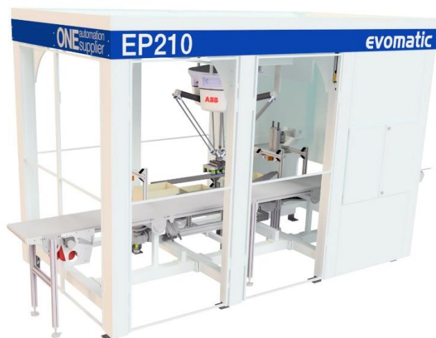
VY FRÅN SIDAN