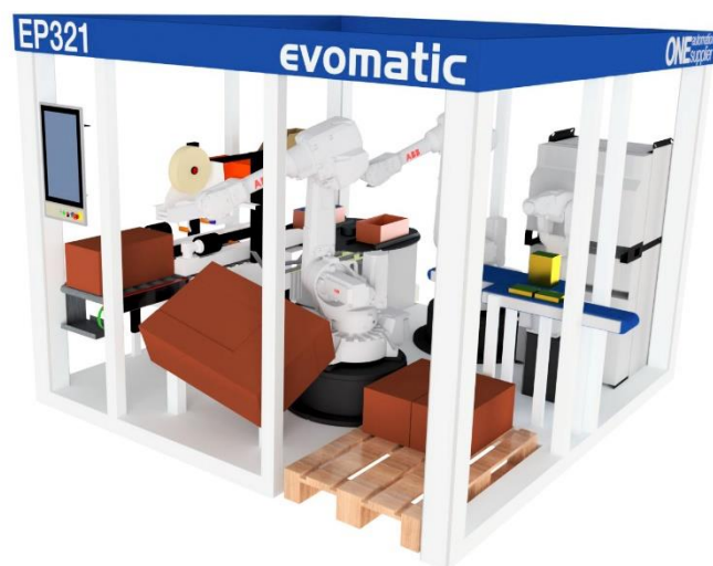
VY FRÅN SIDAN