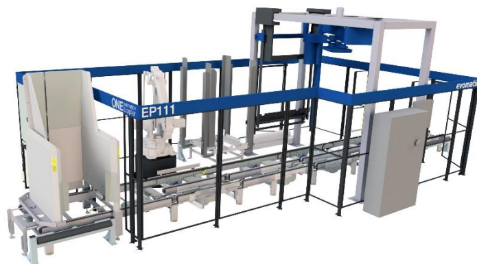
VY FRÅN SIDAN

EP111 är en helt fristående robotcell som med hög precision och takt plockar varierande material från inbana till pall. Cellen har frammatning av pallar med pallmagasin, mellanläggshantering och även inplastning av pall. Grunden är en standardutrustning men med goda möjligheter till kund Anpassning efter specifika produkter och krävande behov.