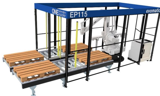
VY FRÅN SIDAN

EP115 är en helt fristående robotcell som med hög precision och takt plockar varierande material från inbana till pall. Cellen byter pallar med hjälp av ett pallsystem. Grunden är en standardutrustning men med goda möjligheter till kundanpassning efter specifika produkter och krävande behov.