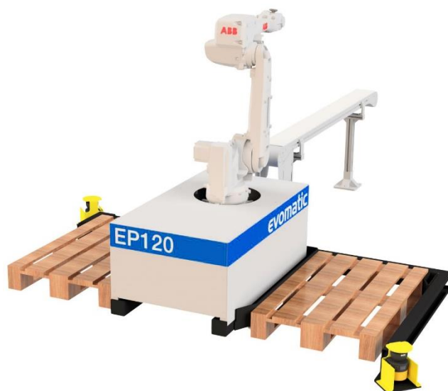
VY FRÅN SIDAN